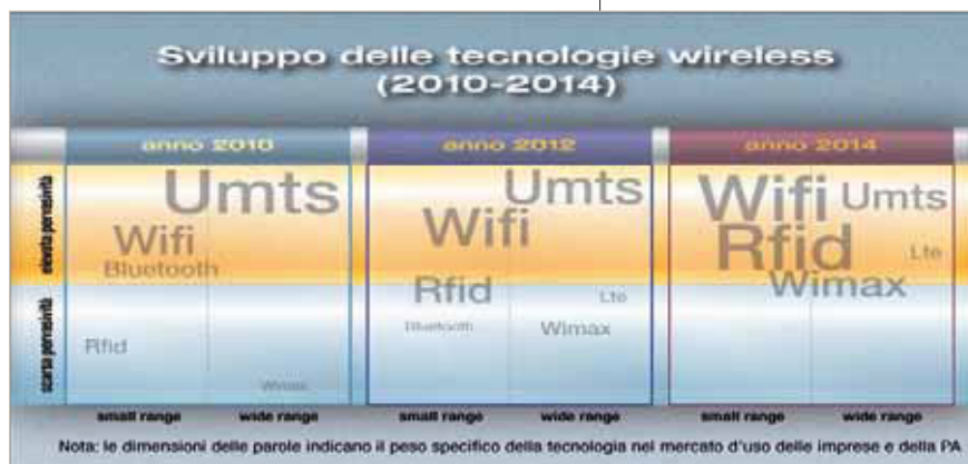
Fig. 2 - Fonte: Cedit

Tra le comunicazioni senza fili il ruolo del trasferimento dati si fa ogni giorno sempre più rilevante. Chetan Sharma Consulting rileva come il contributo al fatturato della trasmissione dati sia superiore al 10% in tutti i maggiori mercati di telefonia mobile, arrivando in alcune realtà anche a superare il 50%. È il caso degli Stati Uniti, dove nel 2009 il traffico dati su dispositivi mobili ha per la prima volta superato quello vocale. A livello mondiale, il fatturato ascrivibile alle comunicazioni dati senza fili nel 2009 è stato di 220 miliardi di dollari, circa il 26% del totale di 1,1 trilioni di dollari. Per diversi operatori telefonici oltre il 50% di tutto il traffico dati senza fili è generato da smartphone come iPhone e Android. L'analisi di CSC prevede che il 2010 sarà il primo anno in cui il numero complessivo di connessioni wireless a banda larga supererà quello