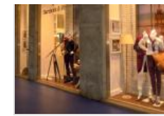
Blaine gira col tag

La soluzione adottata si basa sul software onID di Aton , che gestisce, coordina e governa i flussi di dati Rfid di concerto con l'Erp Oracle Jd Edwards OneWorld, fornito da Atlantic Technologies, a cui è integrato.