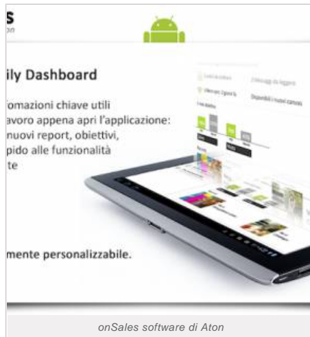
onSales software di Aton

Insomma, l'arrivo di Aton rappresenta un importante riconoscimento per l'ottimo lavoro della società in questi anni, grazie anche ad una grande competenza nei settori chiave del Made in Italy, ovvero il cibo e la moda.